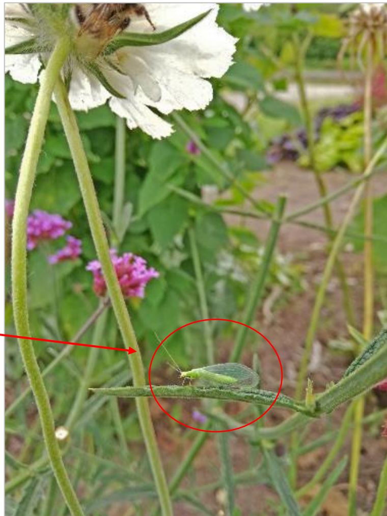
Florfliege als Vollinsekt

Diesmal möchte ich euch zwei Nützlinge (Florfliege und Gallmücke) vorstellen, damit ihr diese als Ei, Larve und Vollinsekt vor dem Pflanzenschutzmitteleinsatz verschonen solltet. Auch beim Besprühen z.B. mit ölhaltigen Mitteln werden vorhandene Nutzinsekten reduziert. Weil die Nützlinge immer erst ihre Eier in die vorhandenen Kolonien der Schadinsekten ablegen, setzt ihre Entwicklung zeitversetzt ein.